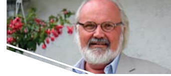
Præst og missionsleder, mangeårig erfaring med unge studerende