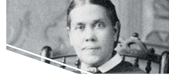
Ellen White Kristen foregangs- kvinde og forfatter

En anden betingelse for virksom bøn er tro. ”For den, der kommer til Gud, må tro, at han er til og lønner dem, som søger ham“ (Hebr 11,6). Jesus sagde til sine disciple, ”Alt, hvad I beder og bønfaller om, det skal I tro, at I har fået, og så får I det“ (Mark 11,24). Tager vi ham på hans ord?