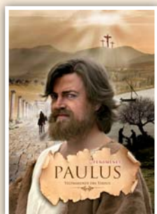
Paulus – teltmageren fra Tarsus 11 studiebreve