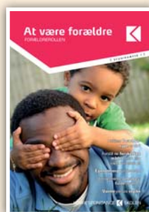
At være forældre 7 studiebreve