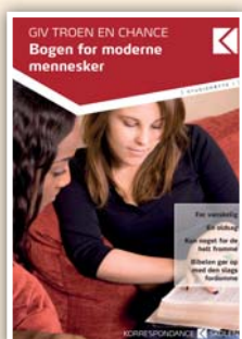
Giv troen en chance 20 studiebreve