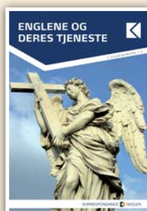
Englene og deres tjeneste 6 studiebreve