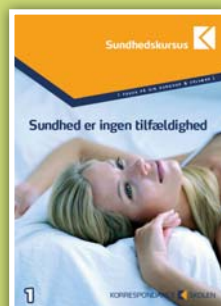
Sundhed 10 studiebreve