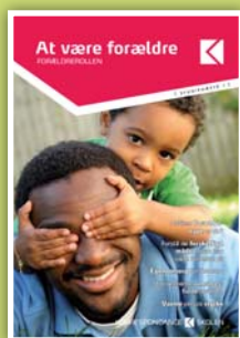
At være forældre 10 studiebreve