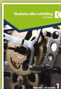
Skabelse eller udvikling 10 studiebreve