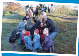
Foto: Terræturen på juletur vest

Grønskollingen er det officielle organ for Adventistspejderne i Danmark. Bladet udkommer i 800 eksemplarer fire gange årligt. Artikler i Grønskollingen udtrykker ikke nødvendigvis spejderkorpsets, redaktionens eller Syvende Dags Adventistkirkens officielle holdninger.