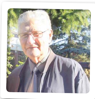
Af: Walder Hartmann

Stol du kun på dit Fadervor, lad dig derfra ej forlokkes, himmel og jord engang forgår, aldrig dog Fadervor rokkes.