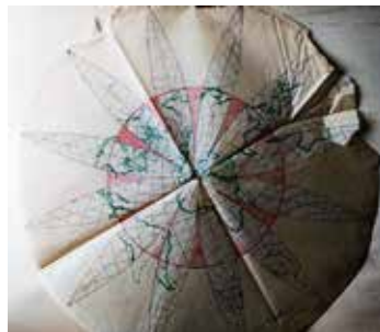
Diagrammer som disse findes i stort antal på ovennævnte internetsites.