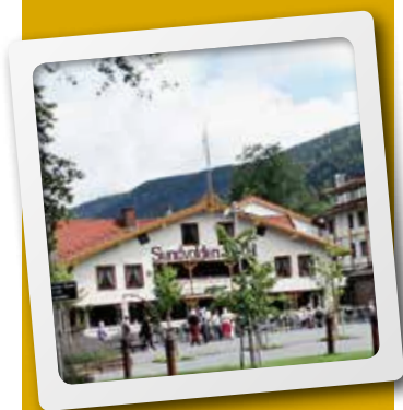
Hotel Sundvolden, hvor årets seniorstævne byder på oplevelser, du nødtig skulle undvære.