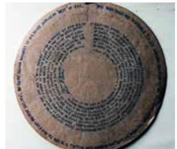
Mere end 100 billeder og diagrammer var skjult i den mystiske æske, der har vakt opmærksomhed på internettet.

” Hvis han vidste det her, ville det have glædet ham og varmet ham meget.